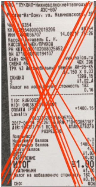
Без QR кода или чек снят не полностью