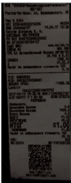
Затемнённый или имеющий тень